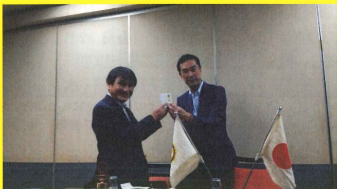
細川前会長、お疲れ様でした！！