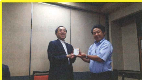
片野前幹事、お疲れ様でした！！